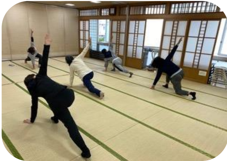
ストレッチサークル