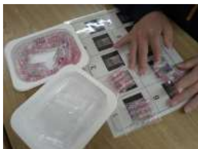
鉛筆キャップの袋詰め 5本1組を10セット作ります。

グループの実態に合わせた作業を設定し、指示を聞く力、集中して取り組む力、手先の巧緻性等が大切なことを確認しました。