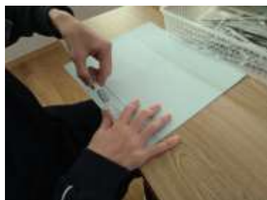
廃棄する紙ファイルを紙とプラスチックに仕分けしています。