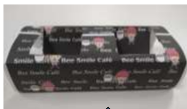
ピースマイルカフェとのコラボのテイクアウト用ケースです。

グループの実態に合わせた作業を設定し、指示を聞く力、集中して取り組む力、手先の巧緻性等が大切なことを確認しました。