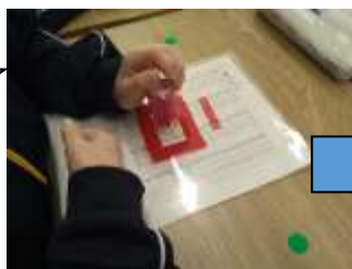
スタンプ押しの練習で使った練習用紙に「済」の印を押しています。不要紙のリサイクル作業です。